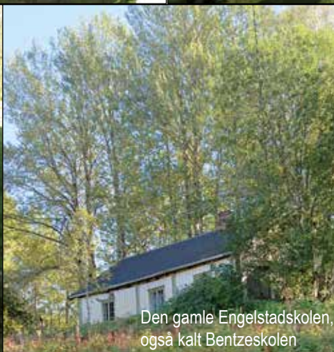
Den gamle Engelstadskolen, også kalt Bentzeskolen