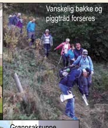
Vanskelig bakke og piggråd forseres