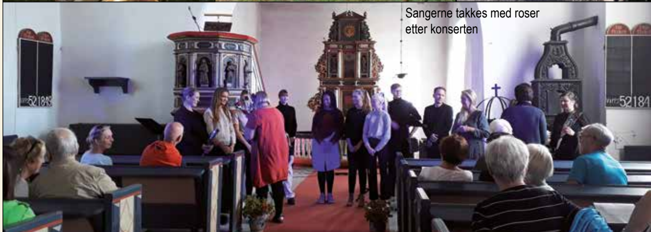
Sangerne takkes med roser etter konserten

Fra Klimakulturpilegrimsvandringen