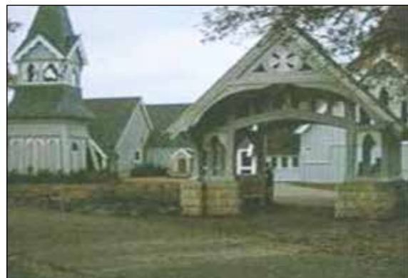
St. Augustine's church