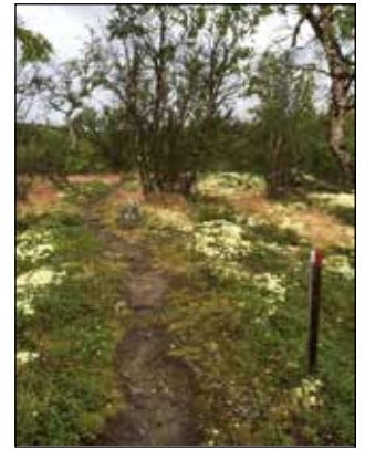
220 km igjen til Nidaros. Men det går an det på slike stier...

utsikt mot fjellområdet Snøhetta. Og tro det eller ei, vi fikk se en moskus som ruslet i lia nedenfor oss. Vi startet dagene med gode «ord for dagen», og med «stille etapper» kunne vi la tankene våre vandre og å tenke over livets store og små viderverdigheter.