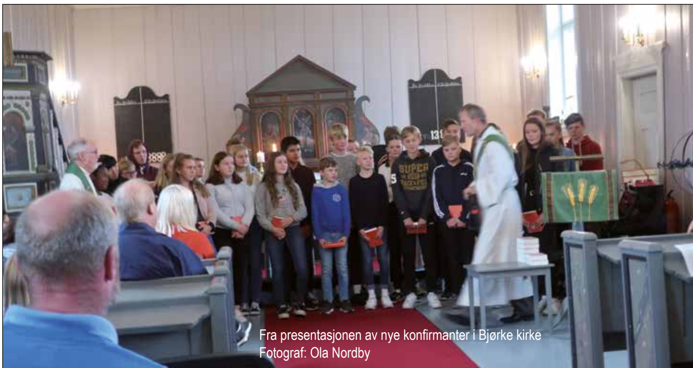
Fra presentasjonen av nye konfirmanter i Bjørke kirke