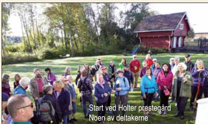
Start ved Holter prestegård Noen av deltakerne