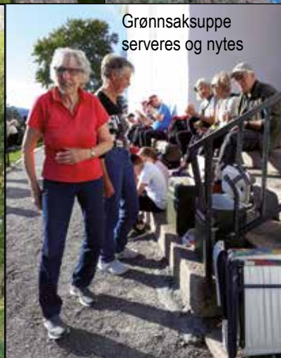
Grønnsaksuppe serveres og nytes